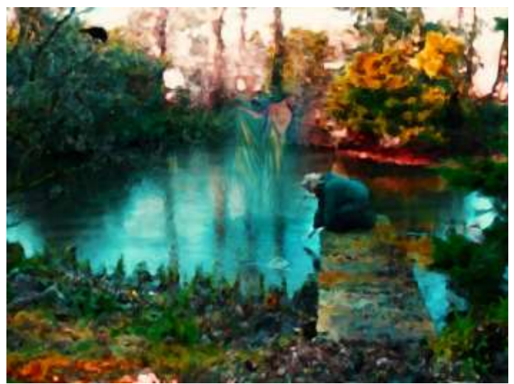
Links Lusthof Soelen 18 e eeuw – Rechts de Braeck, de poel van Nemoland