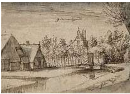
Spaarndammerdijk op de plek van begraafplaats Barbara